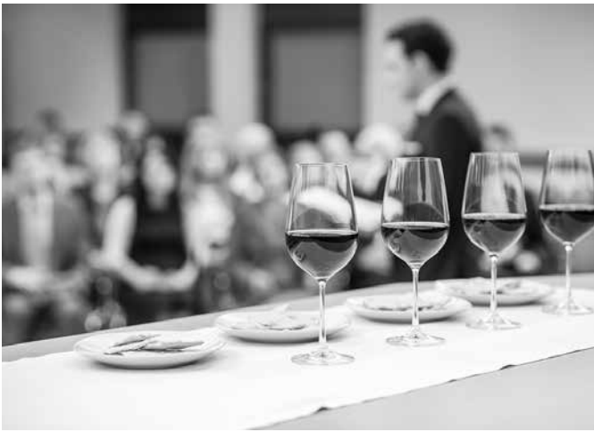
„Gottesdienst am wichtigsten Feiertag von Jehovas Zeugen.“

Sollten Sie an einer dieser Zusammenkünfte per Zoom teilnehmen wollen, so melden Sie sich bitte unter jodue@gmx.de oder Tel: 0157-70279091. Weitere Informationen, sowie das komplette Onlineangebot in Form von Videos und Downloads findet man auf unserer Website jw.org .