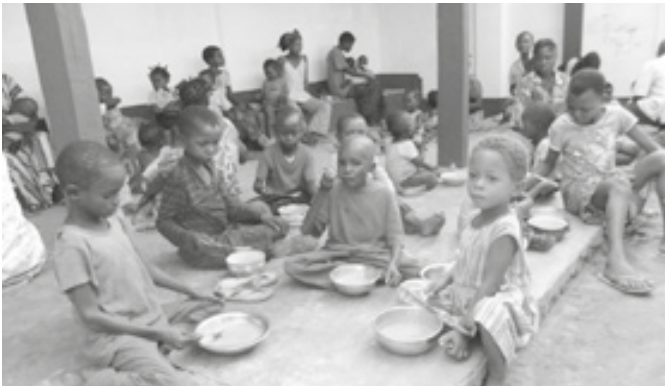
„Kinder bei der Essensausgabe, dreimal wöchentlich“