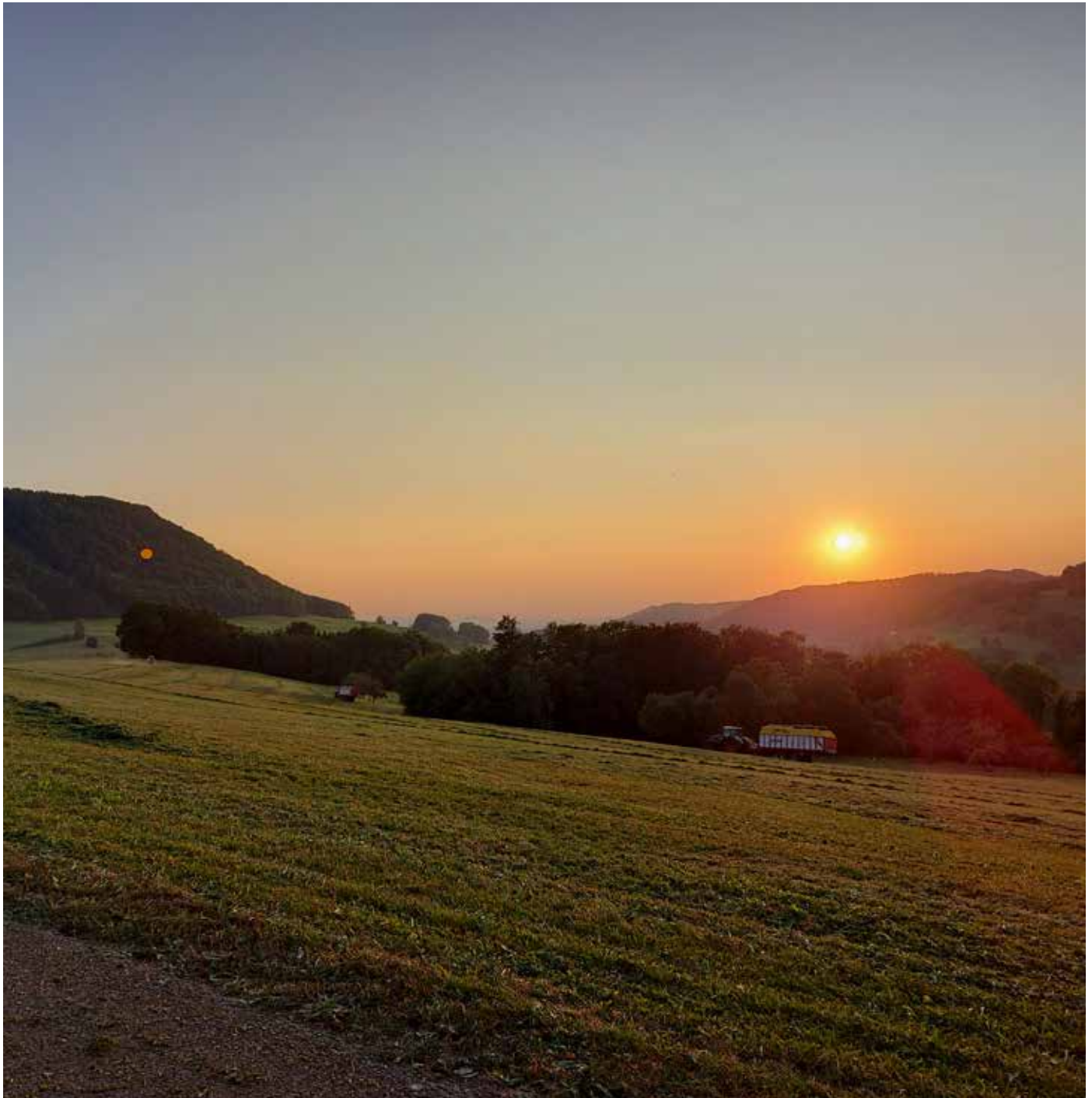
Abendstimmung oberhalb von Nenningen