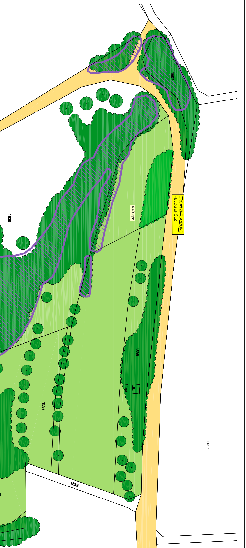
ERSATZMASSNAHME TEIL 1