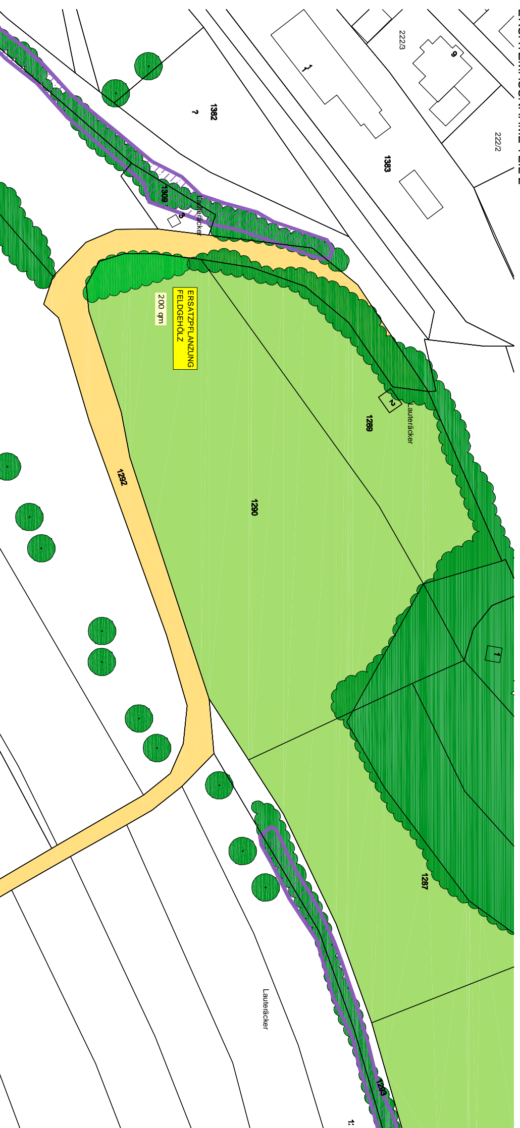
ERSATZMASSNAHME TEIL 2